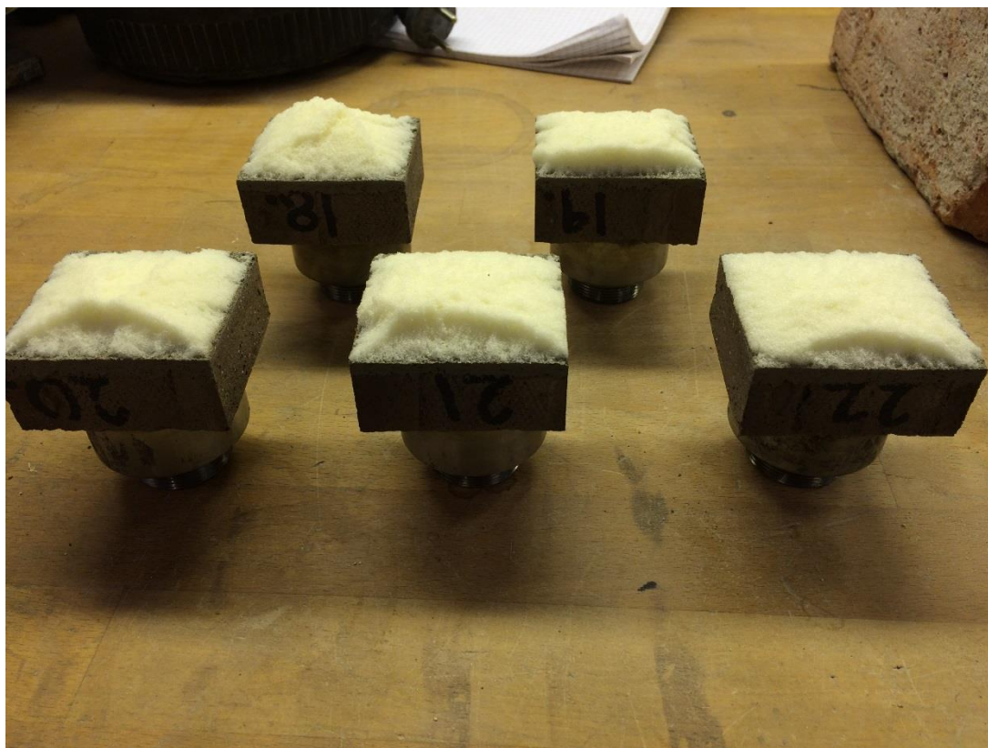
Foto 5. Brudform af PIR-isolering efter aftrækstest.