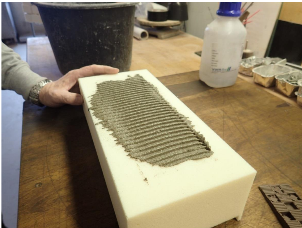
Foto 1. Påført lim med tandspartel 3mm.