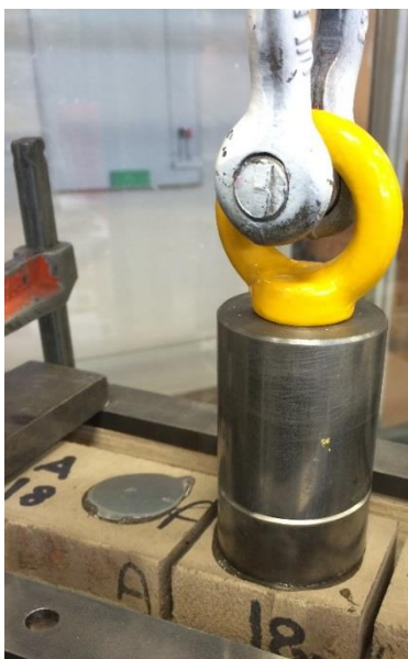
Foto 4. Aftrækstest af mindre areal med med runde ståklodser.