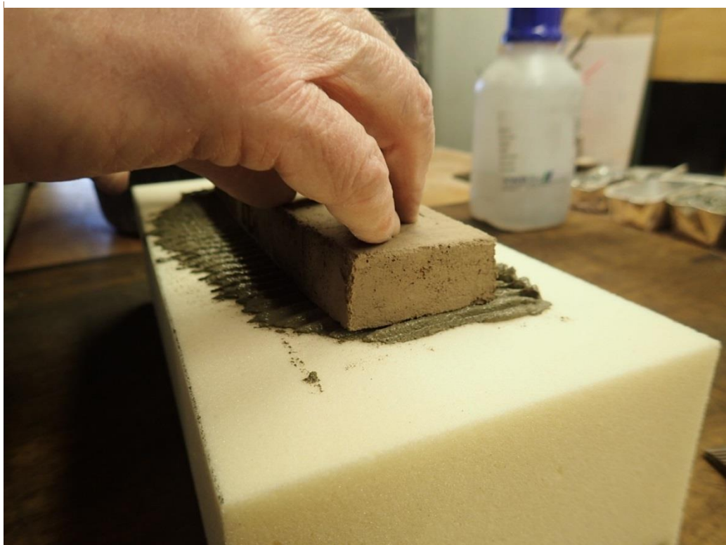
Foto 2. Påføring af murskal